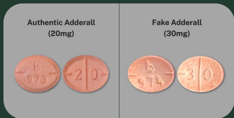
Adderall auténtico (20mg)